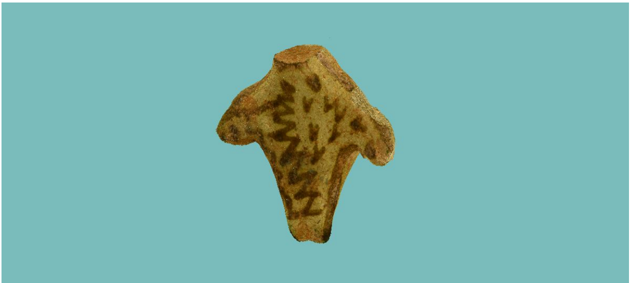
Фигурка человека с поселения телья Ваджеф. Голова отколота в древности. На спине пятно битума, которым, возможно, изображение крепилось к вертикальной плоскости

«В декоре находок сочетаются элементы убейдской культуры Месопотамии, преимущественно периода Убейд 2-3, и культуры, близкой к памятникам Загросской зоны периода Хазине-Мехмех, а также, возможно, более позднего периода Баят, и имеют аналогии с материалами, известными на памятниках Дехлуранской долины», – отметил Шахмардан Амиров.