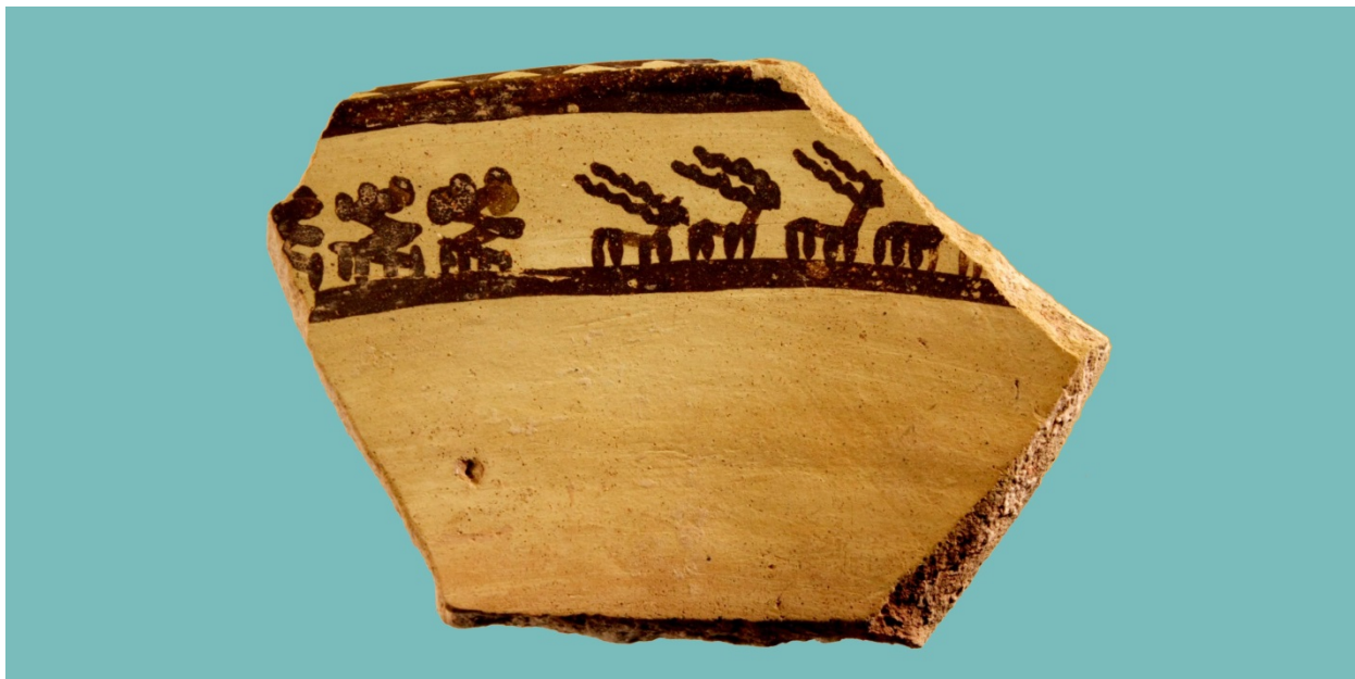
Фрагмент керамики с поселения телля Ваджеф