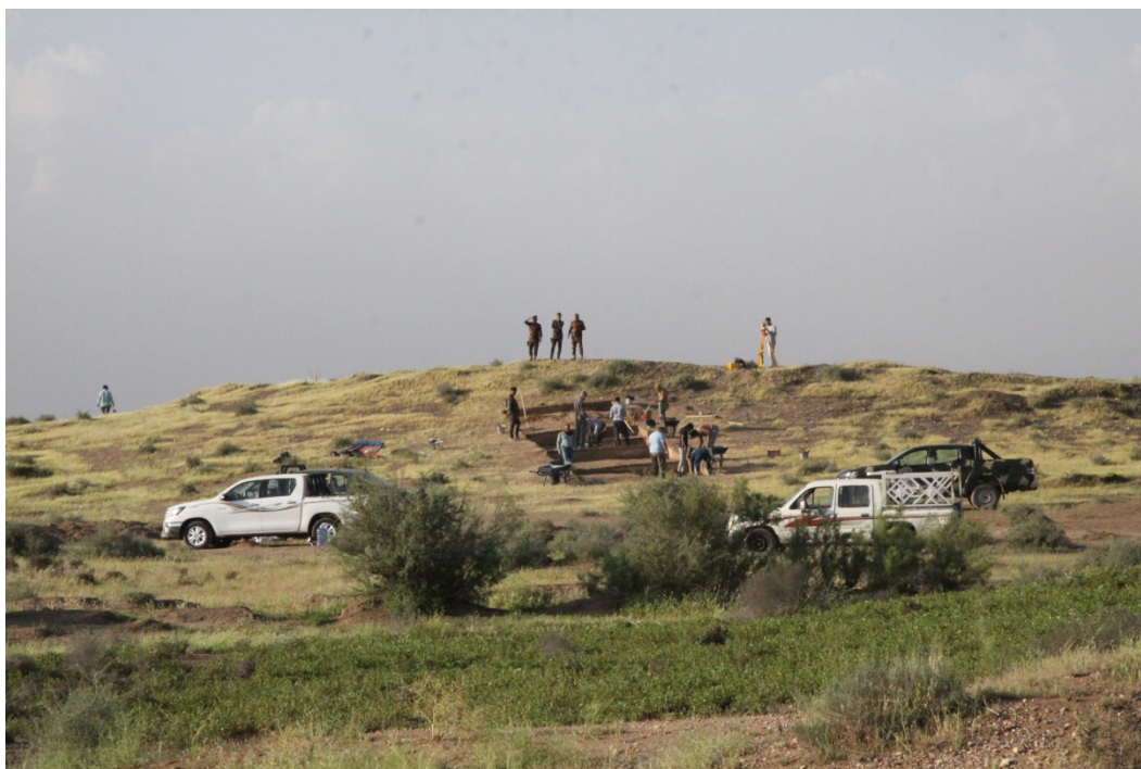
Общий вид на раскоп