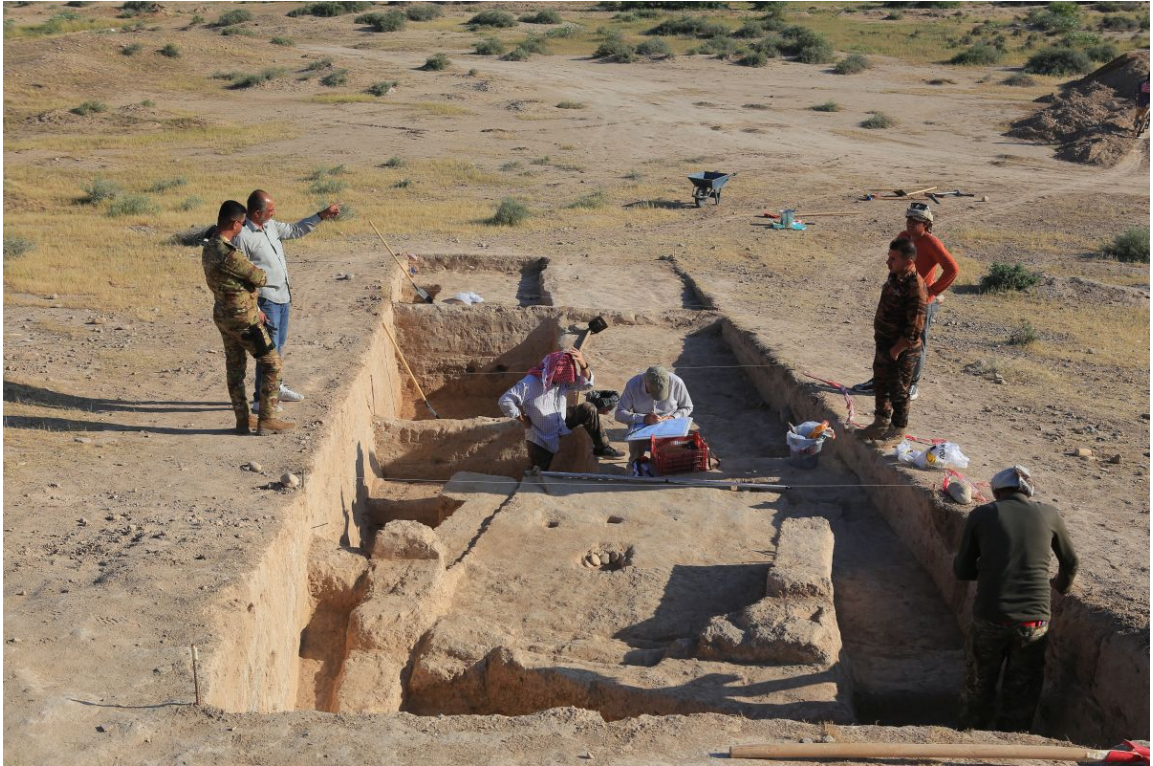
Графическая фиксация выявленного объекта. В раскопе: пол и сохранившаяся сырцовая стена постройки

Исследования показали, что на вскрытом участке культурный слой поселения имеет мощность более 5 метров. На сегодняшний день измерить его точную глубину не удалось, так как в ходе первого полевого сезона на телле археологи не смогли достичь материкового слоя. Археологи заложили в нижней части телля стратиграфический шурф, в котором культурные отложения были прослежены на глубину 1,5 метров ниже современной аллювиальной равнины, но также не достигли материка. Возможно, культурный слой поселения может иметь дополнительную мощность в несколько десятков сантиметров или больше.