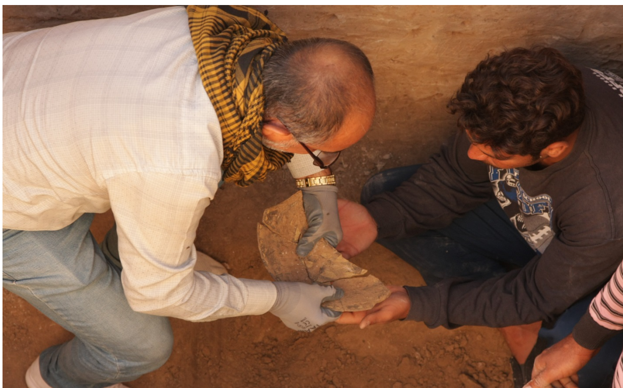
Развал орнаментированного сосуда из культурного слоя