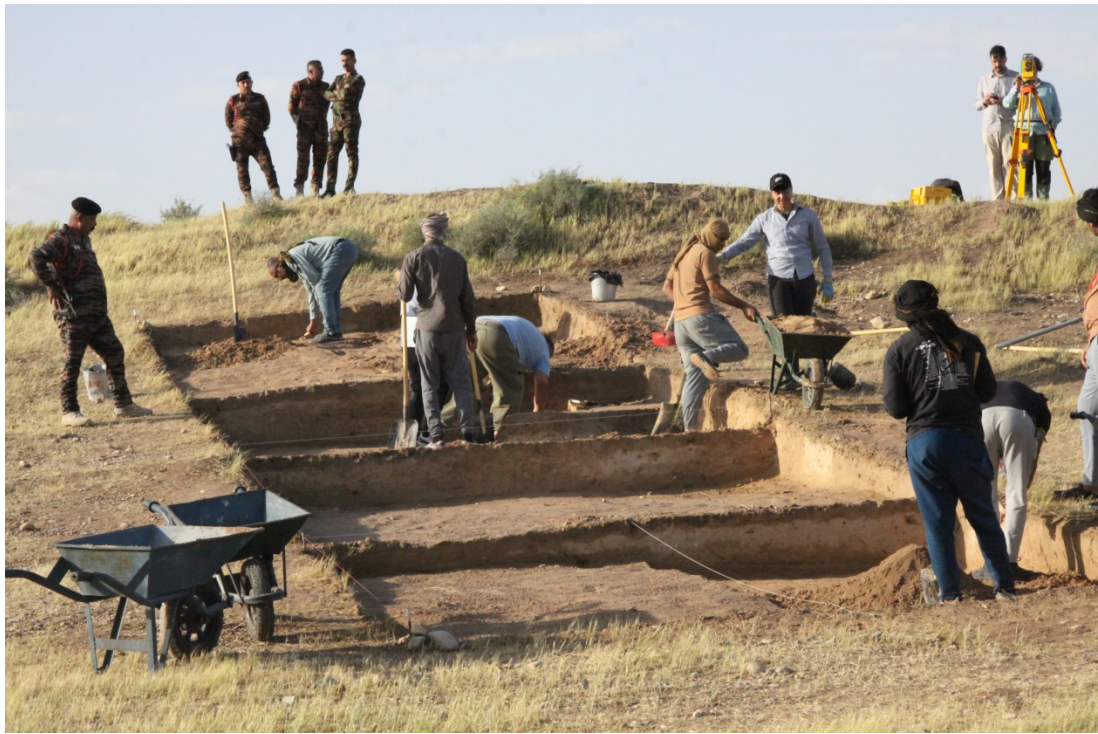
Раскоп. Рабочие моменты

Телль Ваджеф расположен примерно в 10 километрах от низких отрогов Загросских гор и в 500 метрах от современного русла сезонной реки Аль-Тиб (Меймех), левого притока реки Тигр. Сейчас невозможно определить исходную высоту памятника, так как во время ирано-иракской войны холм использовался в качестве огневой артиллерийской точки и был сильно поврежден. Высота телля на сегодня составляет около пяти метров над уровнем современной равнины.